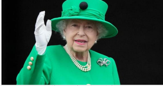
ملكة بريطانيا إليزابيث الثانية

الاثنين - ١٤ ذو القعدة ١٤٤٣ هـ - ١٣ يونيو ٢٠٢٢ م