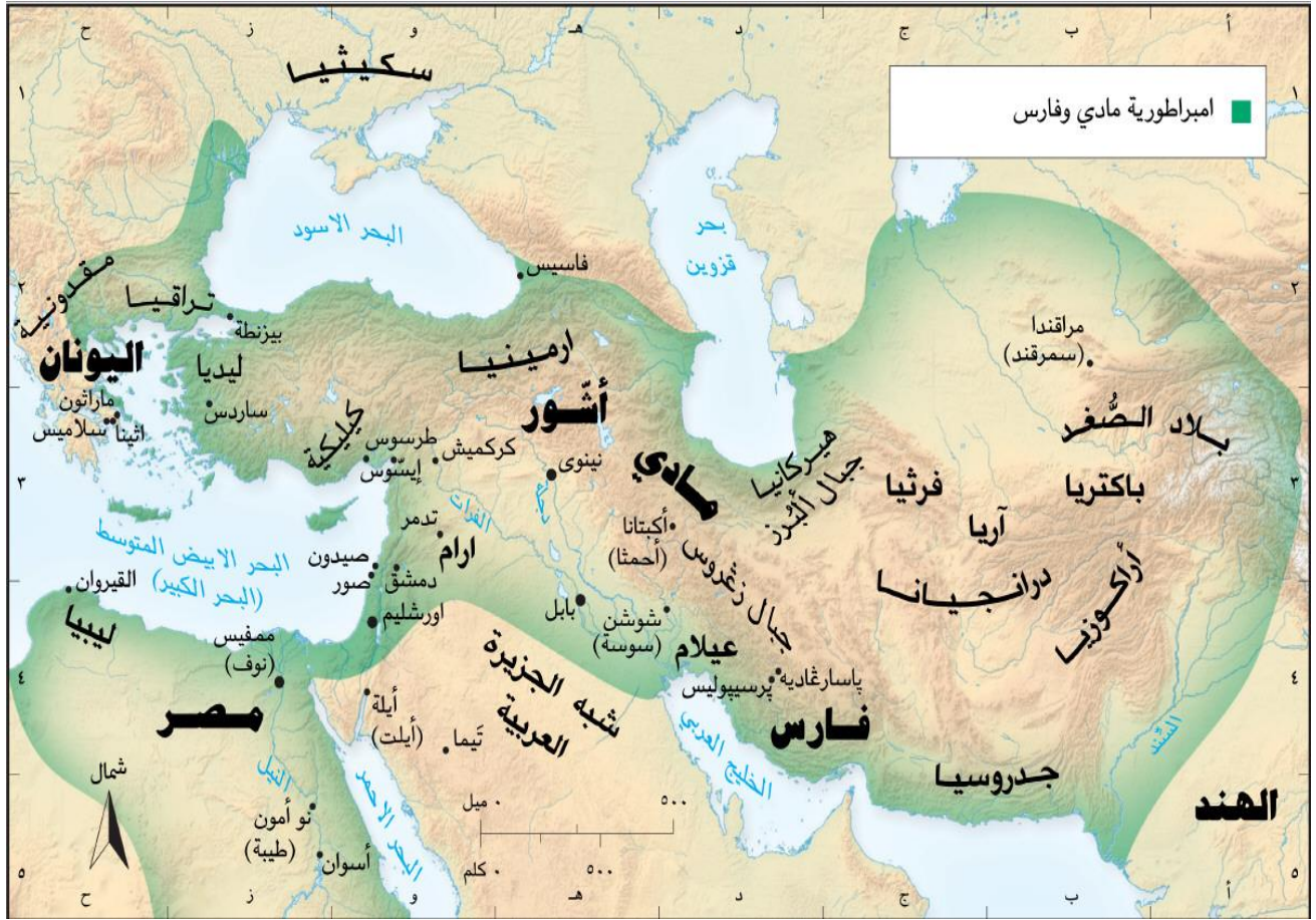
خريطة إيران في عصر الميديين