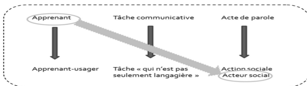
Figure N° (1) : L'apprenant devenu acteur social

Le CECR privilégie dans l'apprentissage, l'enseignement et l'évaluation des langues vivantes une perspective actionnelle : La perspective privilégiée ici est de type actionnel en ce qu'elle considère avant tout l'apprenant d'une langue comme des acteurs sociaux ayant à accomplir des tâches (qui ne sont pas seulement langagières) dans des circonstances et un environnement donnés, à l'intérieur d'un domaine d'action particulier.