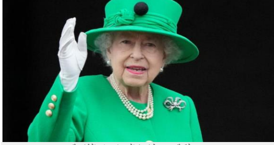
ملكة بريطانيا إليزابيث الثانية

الاثنين - ١٤ ذو القعدة ١٤٤٣ هـ - ١٣ يونيو ٢٠٢٢ م