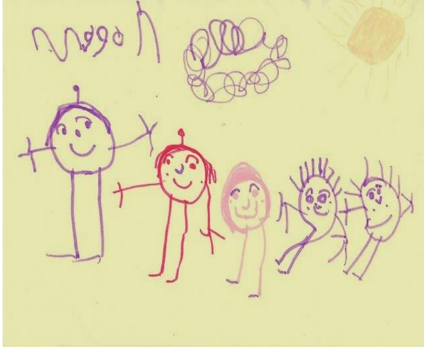
نموذج لرسم اختبار الأسرة المتحركة