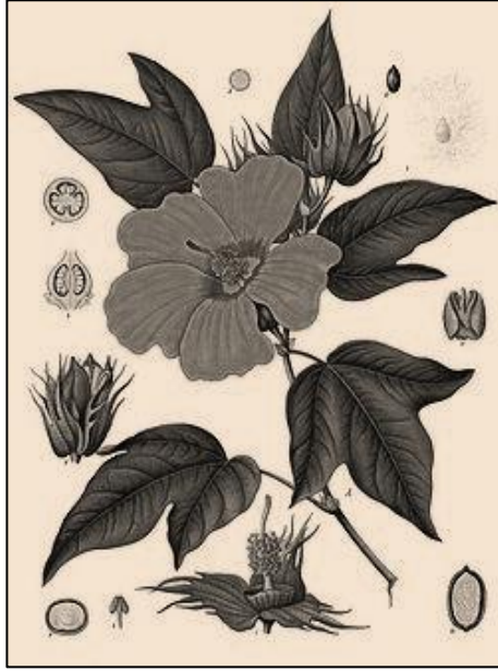
شكل ١: نبات القطن

تتكون الثمرة وتعرف باللوزة بعد ٤٥-٦٠ يوم من التلقيح وهي ثمرة علبة تفتح بمصاريع فتظهر منها ألياف القطن التي تعطي البذور وهي كثرية الشكل.