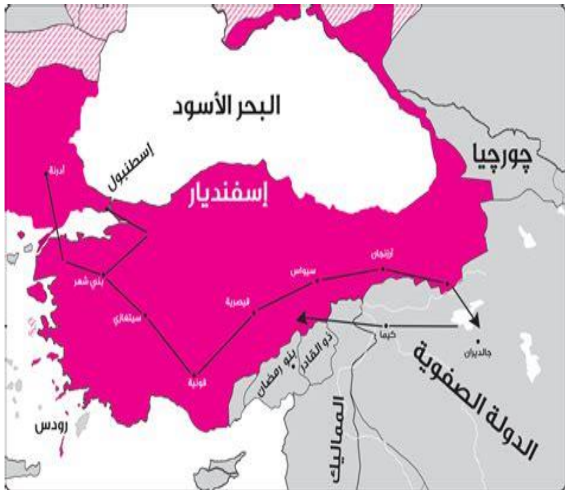
خريطة رقم (٢٣) الحرب الصفوية العثمانية