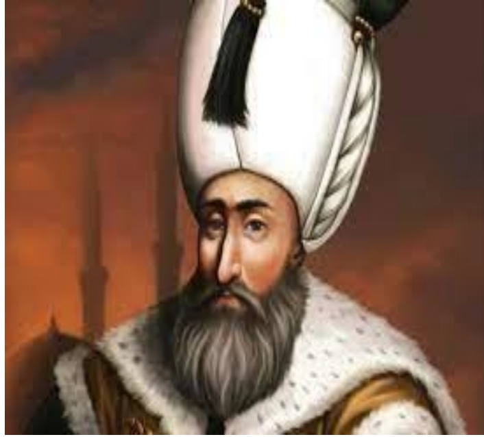
السلطان سليمان القانوني