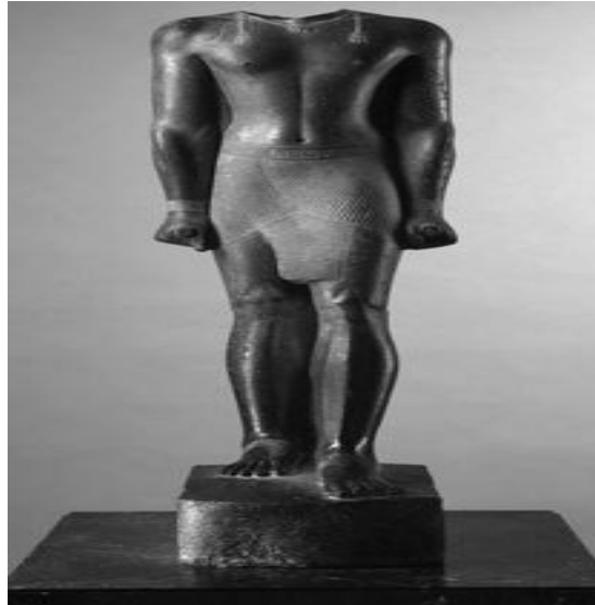
شكل رقم (١) لجندي من مصر القديمة

والحروب والانتصارات ووقت ازدهار واضمحلال حكم الأسرة الفرعونية كواحدة من أعظم الحضارات الكبرى في العالم. وسوف تظل قيمة التعبير الفني عن المجتمع ومشكلاته وتوجهاته السياسية تفرض نفسها بشكل دائم ومستمر، طالما كان هناك مجتمع يتحرك وينبض ويرنو إلى سد حاجاته الثقافية والسياسية، وطالما هناك فنان ذو رؤية وبصيرة ومهارة وهناك أيضاً مجتمع مشغول بقضايا وأفكاره وتوجهاته وأحلامه نحو التقدم والاستقرار السياسي، وسيظل هذا التناول القديم الجديد جدير بالاهتمام في كل الأزمنة والأماكن نحو ابداع فنان في واقع مجتمعي سريع التحول.