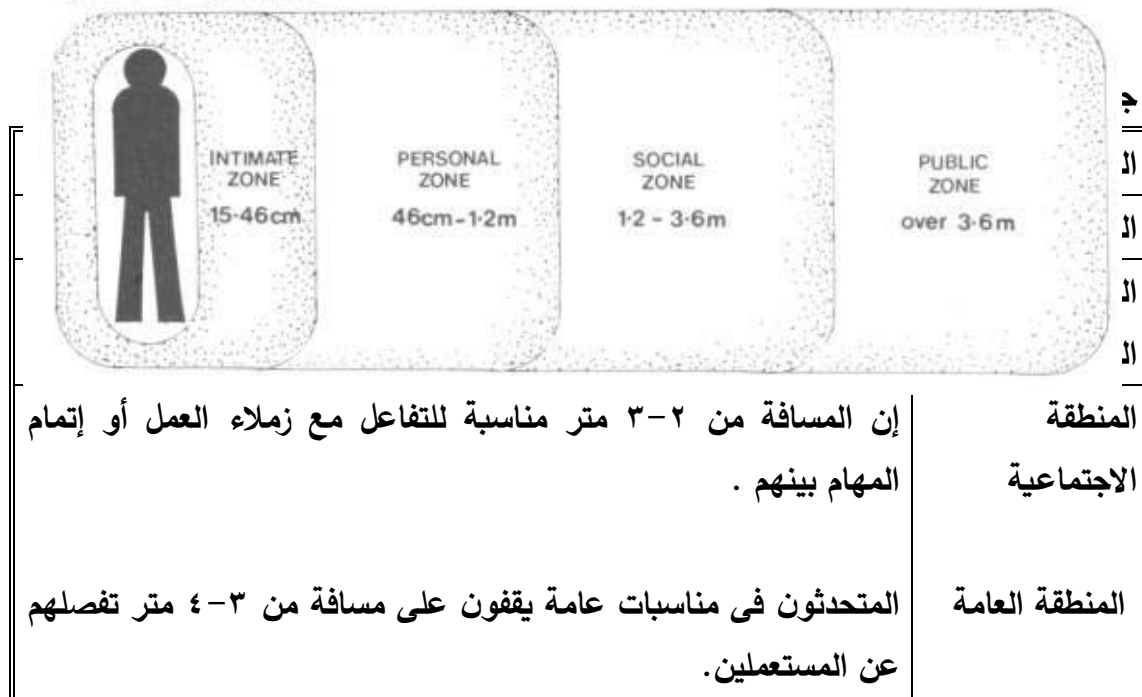
Figure 9 Zone distances

وقد أوضح كل من جارفنكل Garfunkel (١٩٦٤) وفيليب وسومر Sommer&Felipe (١٩٩٦) آثار إنتهاك الحيز الشخصي في سلسلة من التجارب الميدانية. فقد قام هؤلاء المجرّبون بإنتهاك الحيز الشخصي في أماكن عامة مثل المكتبات ومقاعد المنتزهات ، ووجدوا أن الناس يظهرون الحرج والارتباك في تعبيراتهم الوجهية. فمثلاً، الجلوس بجوار شخص ما رغم وجود مقاعد خالية في المنتزه يجعل هذا الشخص يقوم بأحد أمرين إما النهوض أو الانتقال بعيداً عن