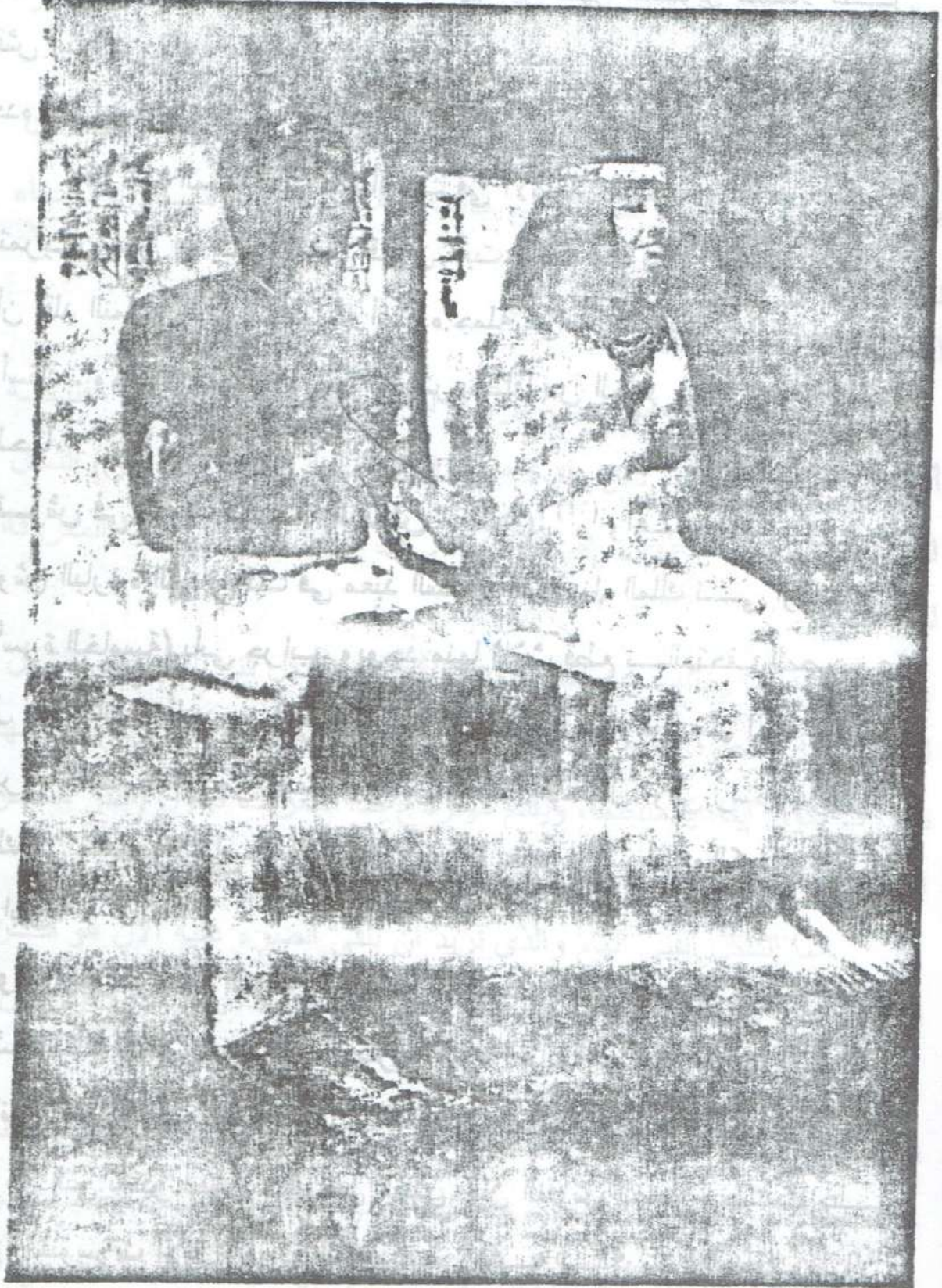
تمثال الاميرة تونت ( ومعنى اسمها « الجميلة » ) وزوجها رع حنب . والتمثال من الاسرة الثالثة ، اكتشف بميدوم ومحفوظ الآن بالمتحف المصرى ( رقم ٢٢٣ )