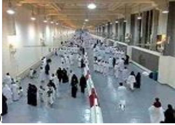
السعي بين الصفا والمروة

وَالْمُقَصِّرِينَ (١) ، وإذا كان متمتعًا بالعمرة إلى الحج وليس هناك مدة يطول فيها الشعر، فإن التقصير أولى، ويؤخر الحلق إلى الحج.