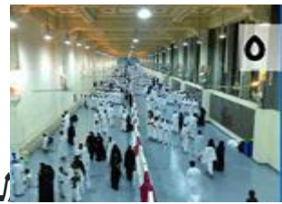
السعي بين الصفا والمروة