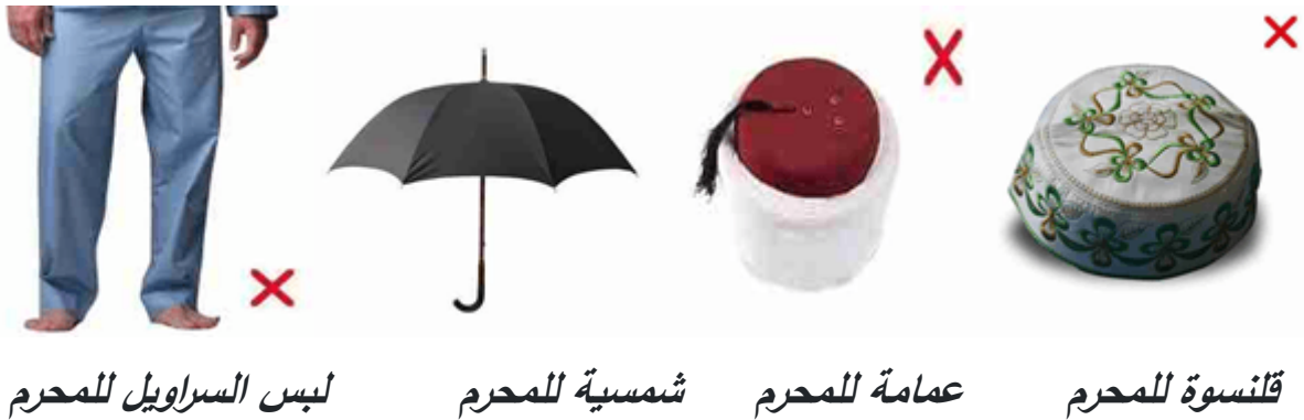
لبس السراويل للمحرم

لحديث ابن عمر رضي الله عنه أن رجلاً قال: يا رسول الله، ما يلبس المحرم من الثياب؟ فقال رسول الله صلى الله عليه وسلم: "لَا تَلْبَسُوا الْقُمُصَّ، وَلَا الْعَمَائِمَ، وَلَا السَّرَاوِيلَاتِ [هو ما يعرف بالبنطال] وَلَا الْبِرَانِسَ [البرانس: هو كل ثوب رأسه منه ملتزق به]" (١) ، وقال (صلى الله عليه وسلم) في المحرم الذي مات: "وَلَا تُخَمَّرُوا رَأْسَهُ [لا تخمروا رأسه: لا تضعوا له خماراً وهو غطاء الرأس]؛ فَإِنَّهُ يُبْعَثُ يَوْمَ الْقِيَامَةِ مُلَبَّبًا" (٢) . فإن لم يكن ملاصقاً لرأسه، كأن يستعمل مظلة (شمسية)، أو خيمة أو سقف بيت أو سيارة فلا إثم عليه.