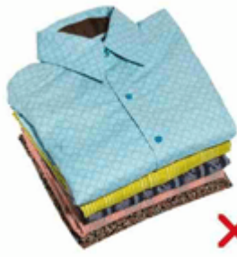
لبس المخيط للمحرم

فإذا لم يجد مُريد الإحرام إزارًا فله أن يلبس السراويل إلى أن يجد إزارًا [كمن نسي ملابس الإحرام في حقيبة سفره في الطائرة أو الباخرة وليس معه إزار، فله أن يخلع ثيابه ويحرم في سراويله ويلف القميص على صورة لبس الرداء؛ حتى إذا وصل إلى الميناء أخرج ملابس إحرامه ولبسها، ولا شيء عليه] ، وإذا لم يجد نعلين فله أن يلبس الخفين؛ لقول النبي صلى الله عليه وسلم: (فَإِنْ لَمْ يَجِدْ نَعْلَيْنِ فَلْيَلْبَسْ خُفَيْنِ، وَلْيُقِطْعُهُمَا حَتَّى يَكُونَا إِلَى الْكَعْبَيْنِ) (١).