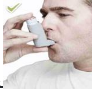
بخاخة الربو لا تفطر