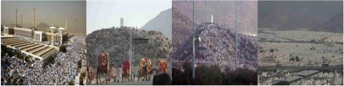
مسجد نَمْرَة مسجد الصخرات جبل الرحمة منى

٢- مسجد نَمْرَة: نَمْرَة جبل غرب المسجد، وبه يسمى مسجد نَمْرَة ، وقد نزل النبي (صلى الله عليه وسلم) ببطن وادي عُرْنَة وخطب وصلى، فبني المسجد في موضع خطبته وصلاته (صلى الله عليه وسلم) ببطن وادي عُرْنَة في أول عهد الخلافة العباسية، وقد تَمَّت تَوْسِيعُهُ وعمارته في العهد السعودي، حتى أصبحت مساحته أكثر من ١١٠ ألف متر مربع، ويجتمع فيه الحجاج في اليوم التاسع من شهر ذي الحجة.