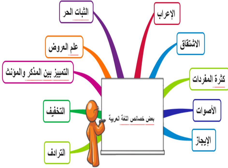
شكل (١) بعض خصائص اللغة العربية