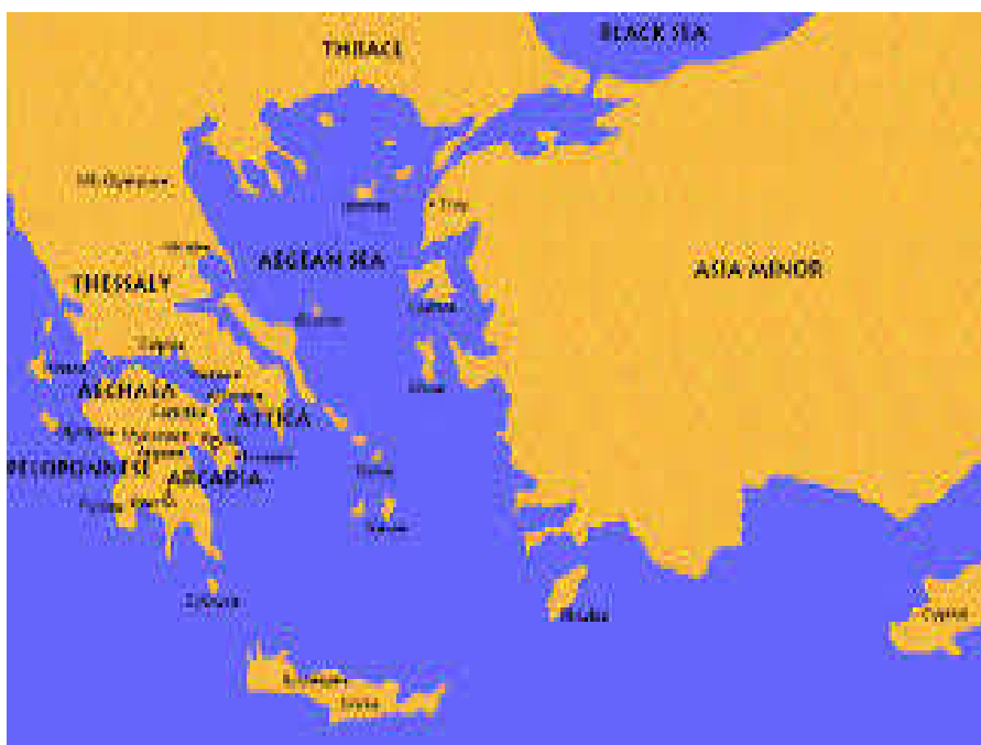
خريطة لموقع كريت

وإذا كانت حضارة كريت حضارة غير يونانية بشكلٍ خالص، إلا أن تأثيرها أمتد إلى بلاد اليونان، وسميت بالإيجية نسبة إلى بحر إيجه، والكريتية نسبة إلى جزيرة كريت أقوى مراكزها الحضارية، وسميت بالمينوية نسبة إلى بيت مينوس، البيت الحاكم في كريت (١) ، وأول من أطلق على هذه الحضارة أسم الحضارة المينوية هو السير "آرثر إيفانس"، بينما يطلق آخرون عليها اسم الحضارة الكريتية، تلك الحضارة التي استمر ازدهارها حوالي ١٥٠٠ عام (٢) .